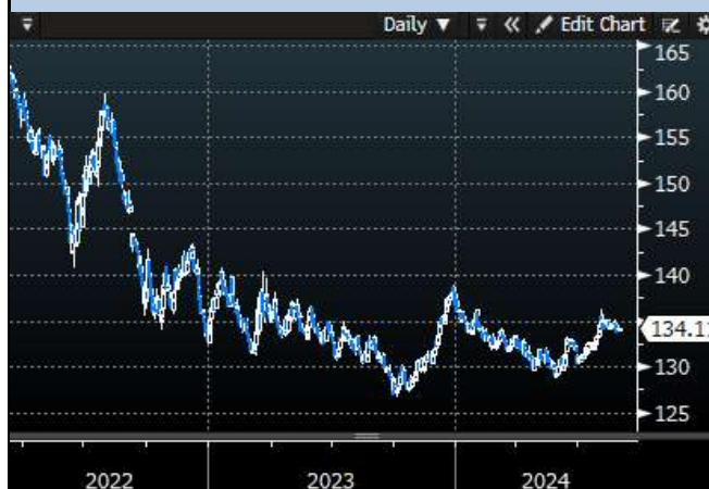
Bund Future Price - 10Y