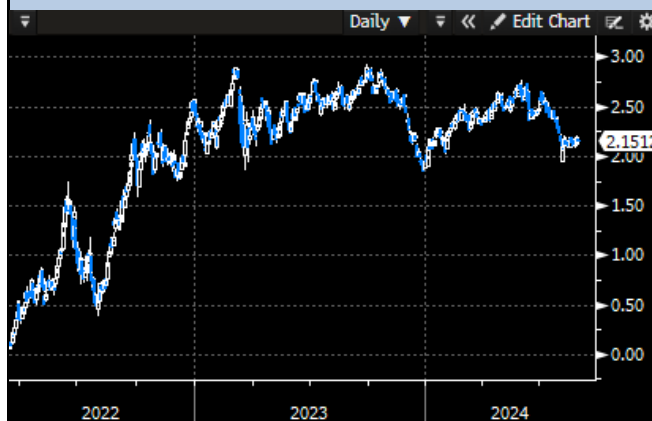
EU 5Y Yield