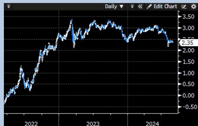
EU 2Y Yield