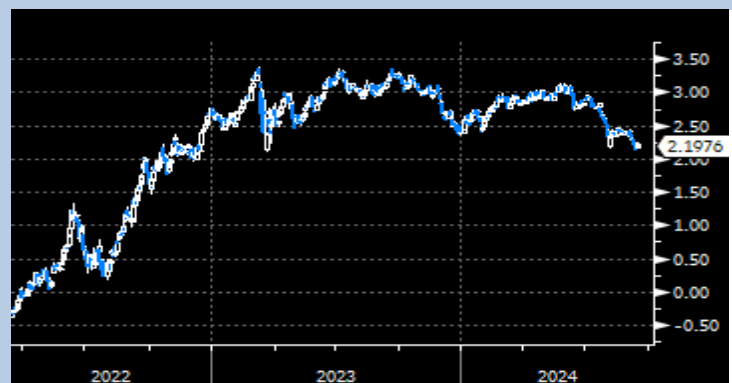
EU 2Y Yield