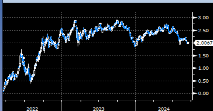
EU 5Y Yield