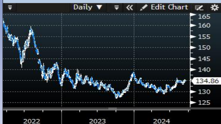
Bund Future Price - 10Y